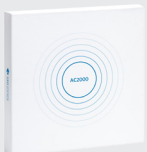
AC2000 AC2000 Airport AC2000 Lite